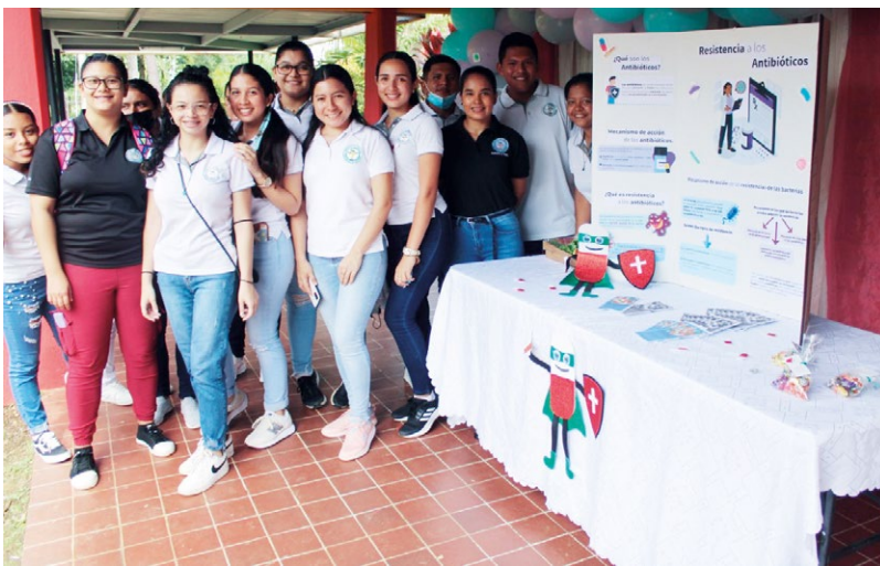
Pabellones informativos sobre resistencia antimicrobiana, por estudiantes de farmacia