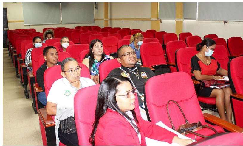
Auxiliares de Bienes Patrimoniales y Contabilidad, en capacitación, Cruv.