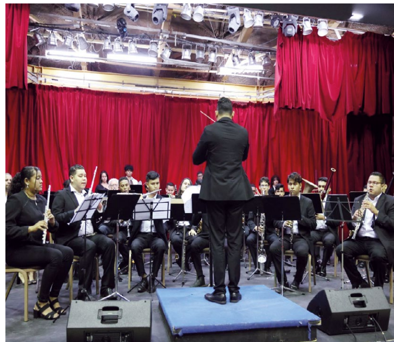
Banda Académica de la Facultad de Bellas Artes.