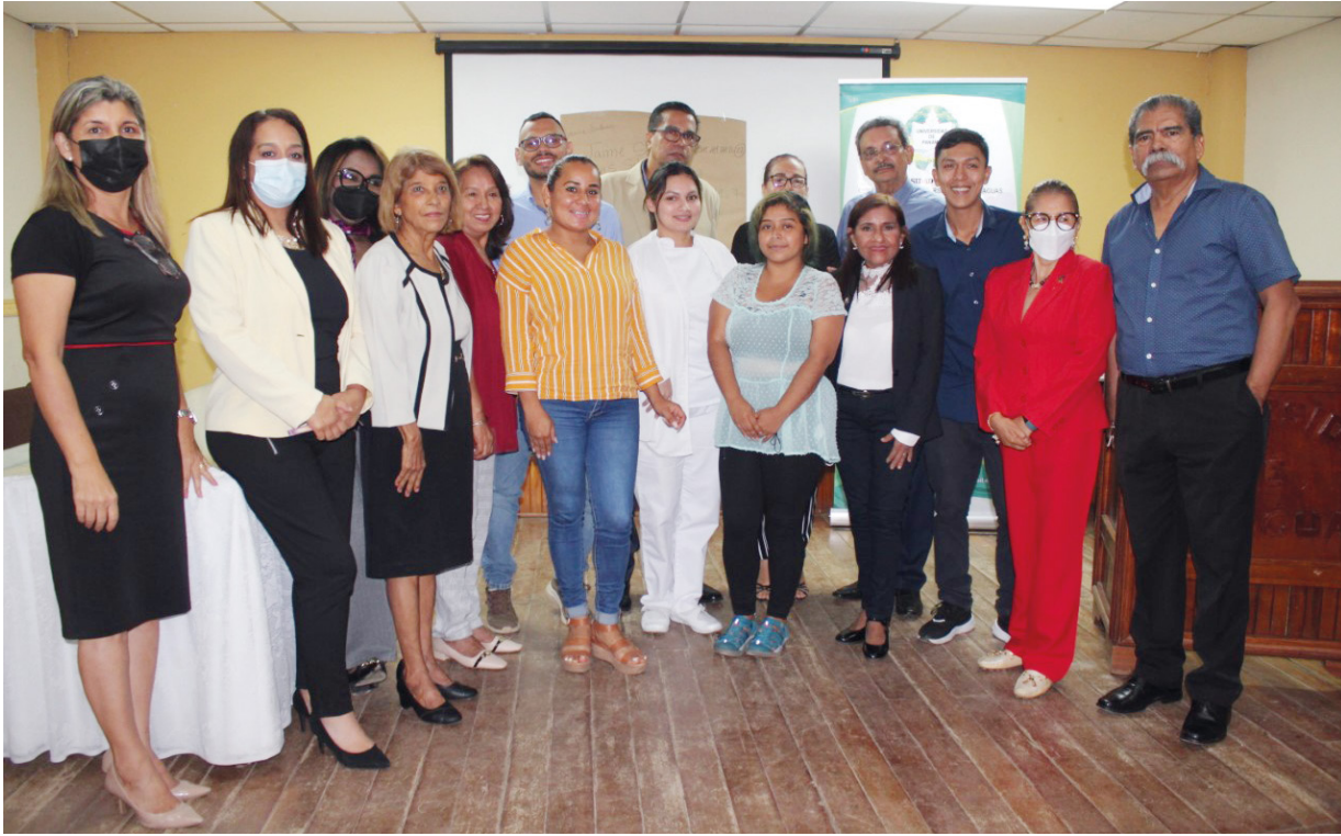
Miembros de la Asociación de Graduandos de vínculos de egresados. Les acompaña el director del Cruv.