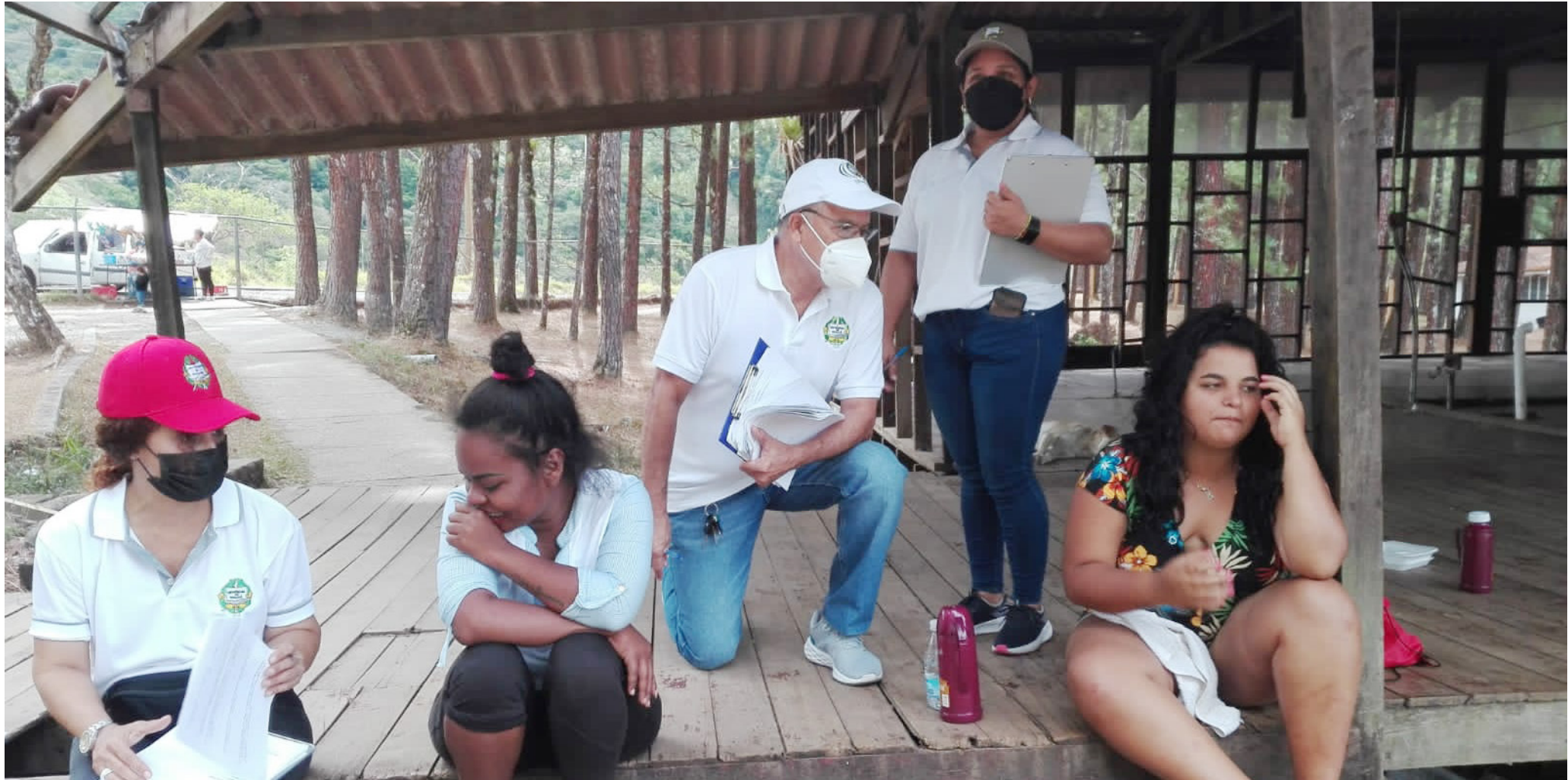
Funcionarios del Instituto del Canal de la UP aplican encuestas a jóvenes de Angola y Venezuela.