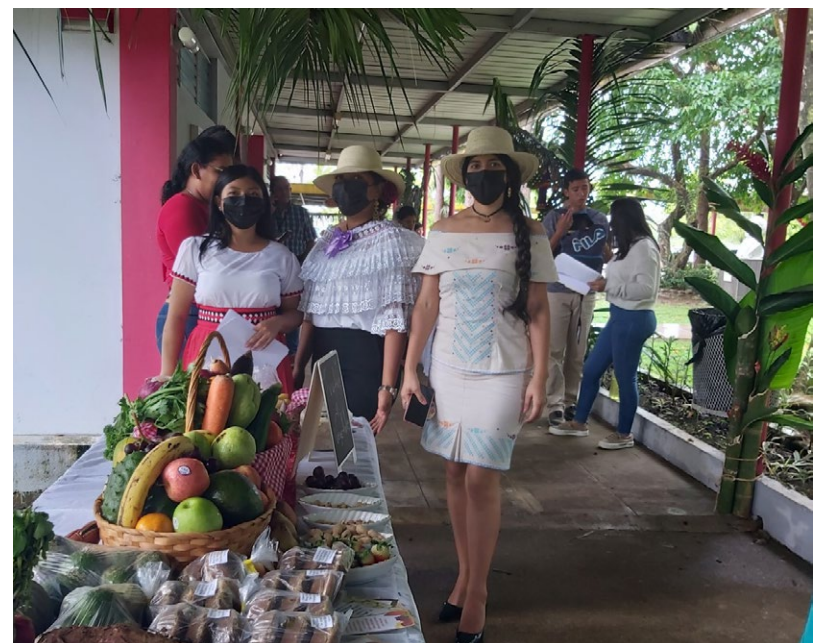
Estudiantes de la Escuela de Familia y Desarrollo Comunitario exponen productos saludables.

Finalmente, la premiación de los ganadores de los diferentes concursos: vestuarios típicos y reyes del reciclaje.