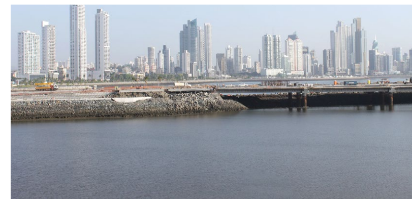
Ciudad de Panamá.

gastos de todo tipo; viajes y compras innecesarias. Esto le permitiría tener un control sobre el presupuesto, puntualizó.