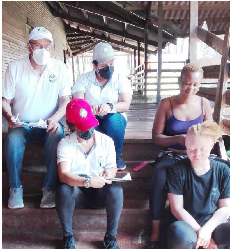
Migrantes de Angola y Haití figuran entre los encuestados.