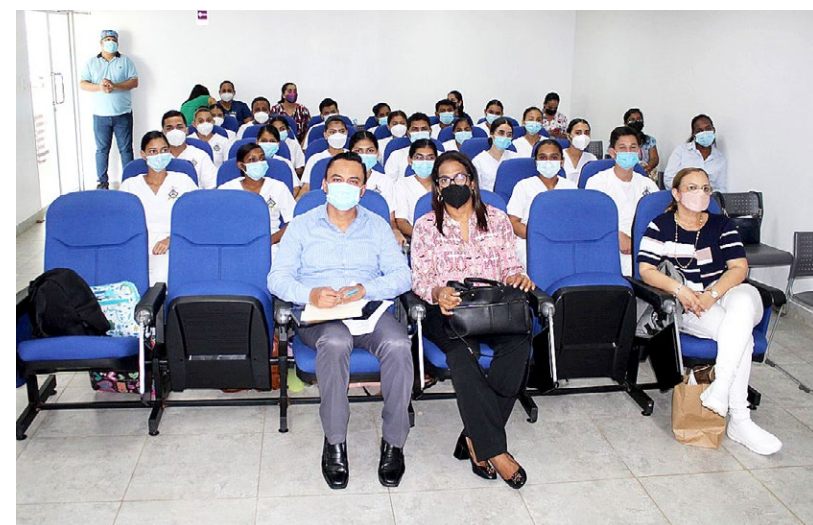
Docentes, estudiantes y administrativos participan en capacitación.