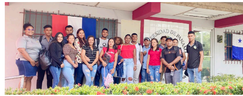
Primeros estudiantes que participan de las veedurías con la CGR.

La Universidad de Panamá participó con conferencias, ponencias, charlas, seminarios y actividades para concienciar a sus estamentos en el uso adecuado de los antibióticos en cuanto a dosis, frecuencia y duración del tratamiento. Mediante la exposición del tema una mirada a la nueva reglamentación de la Ley 1 del 10 de enero de 2001, la Facultad de Farmacia capacitó a los estudiantes. La referida norma regula el manejo general de fabricación, importación, adquisición, distribución, comercialización, y otros aspectos relacionados con medicamentos terminados.