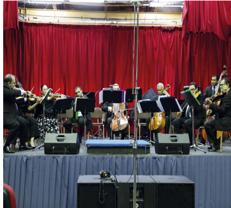
Orquesta de Cámara de la Universidad de Panamá.