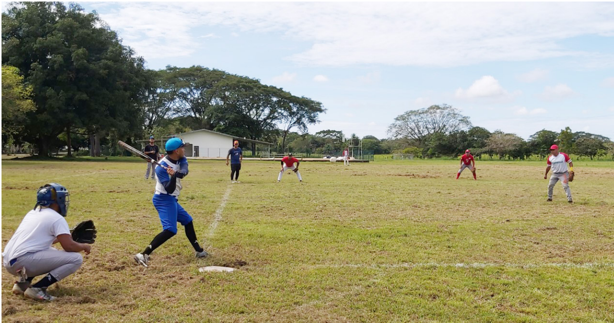
Encuentro deportivo de sóftbol, FCA vs Universidad Tecnológica de Panamá.