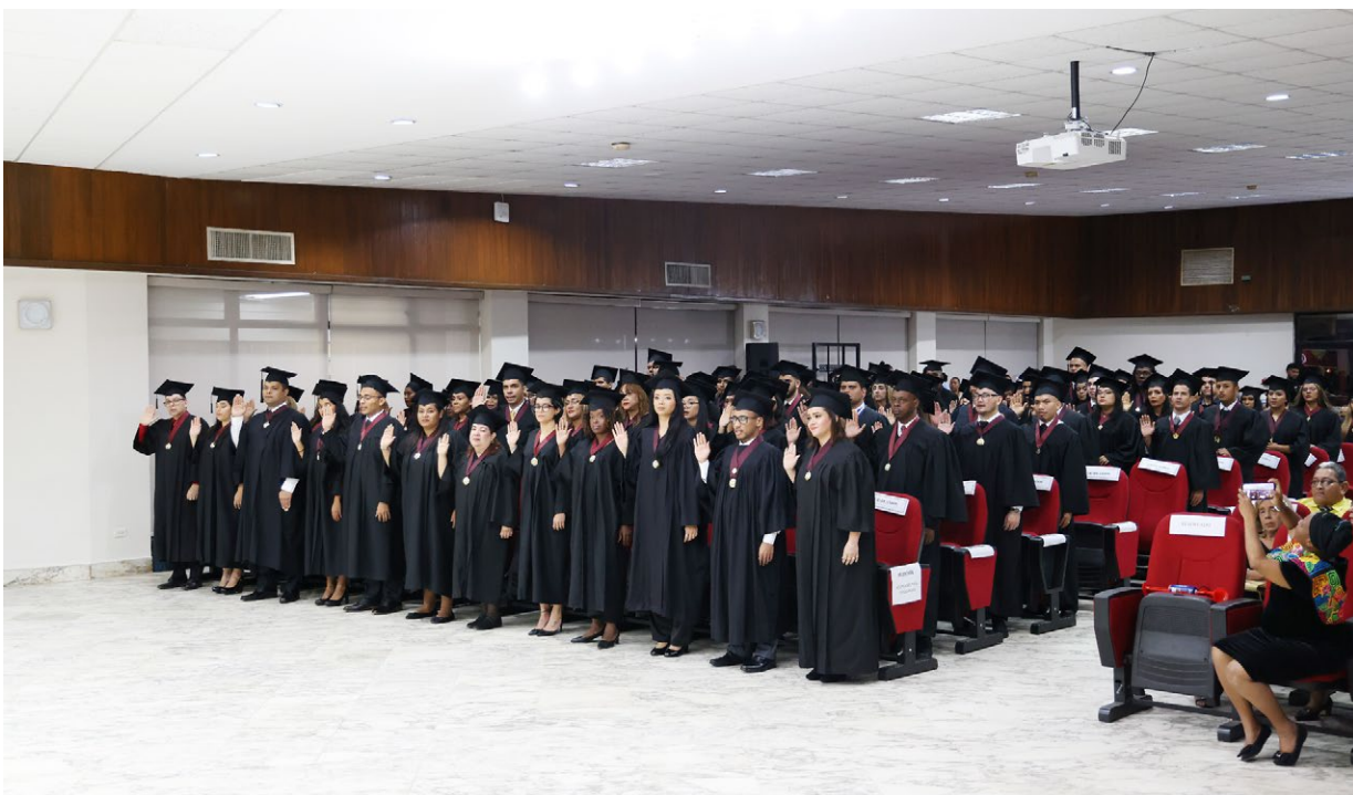
Promoción 2021 – 2022 de la Facultad de Humanidades.