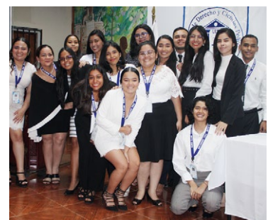
Luris Club, grupo estudiantil de Derecho Cruv.