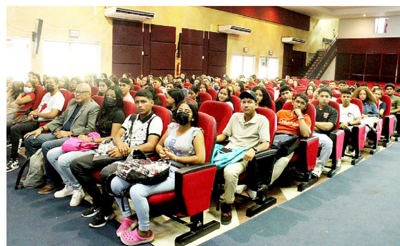
Estudiantes de primer ingreso del Crua inician curso propedéutico.

Su participación les permitirá conocer cómo un equipo de profesionales triunfó en el desempeño de sus emprendimientos y las estrategias que ellos pueden aplicar para el éxito de su carrera profesional.