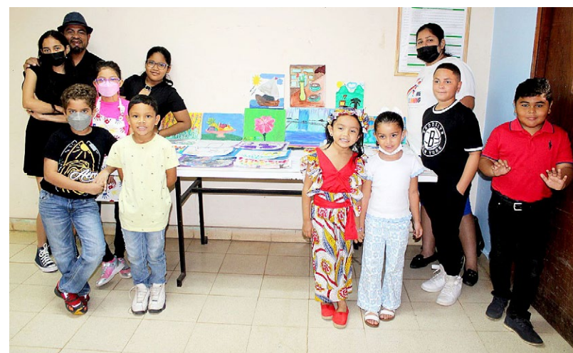
Participantes expusieron sus trabajos de curso.