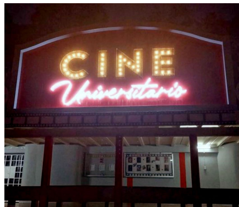
Instalaciones del Cine Universitario.

La sala, uno de los departamentos que conforman el Grupo Experimental de Cine Universitario (Gecu), de la Vicerrectoría de Extensión, ha sido faro cultural y cinematográfico casi permanente desde sus inicios, guiando y estimulando el acercamiento y el gusto por el [RK1] buen cine de generaciones de espectadores, a través de muestras, ciclos, retrospectivas y actividades complementarias y formativas relacionadas con el quehacer fílmico nacional e internacional.