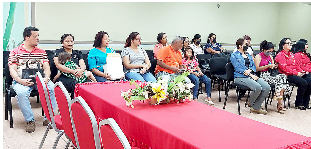
Docentes de la FCA participan en conversatorio con representantes de la Sociedad de Ayuda al Inmigrante Hebreo.