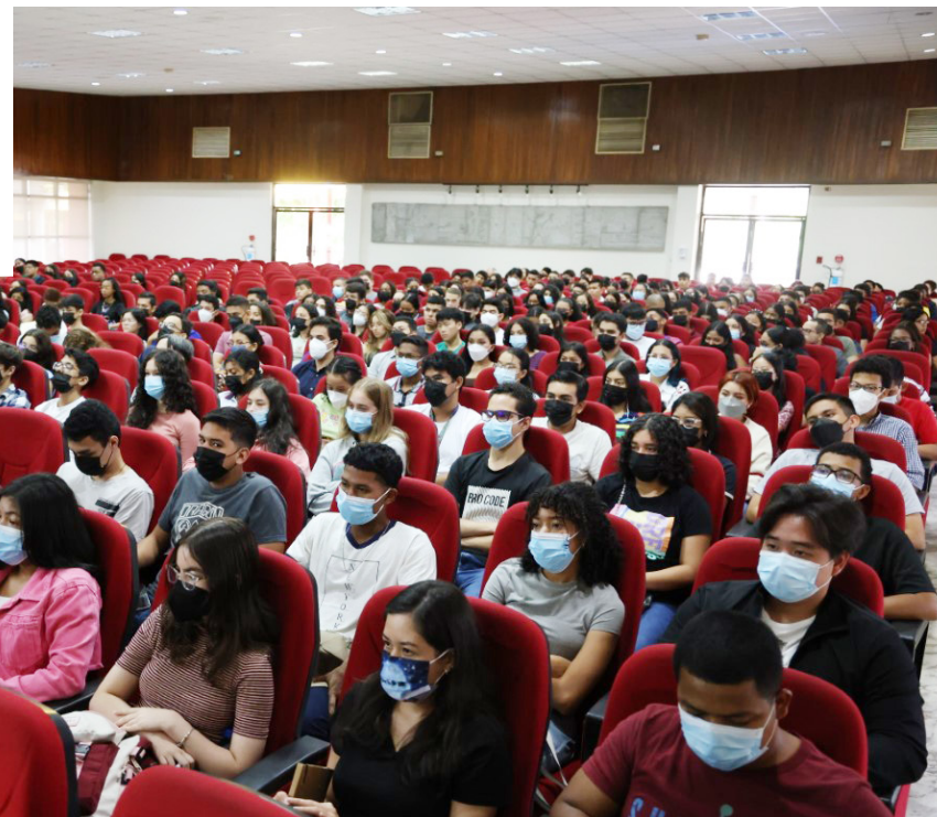
Estudiantes de la Facultad de Medicina inician período de inducción a la vida universitaria.