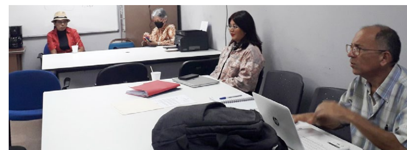
Profesores de diversas áreas del saber participan en la reunión del CIE.