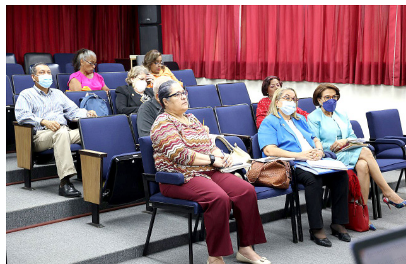
Asistentes al taller de las diferentes facultades y unidades administrativas.

Agregó que la Facultad de Medicina también entrará en el proceso con el Consejo Mexicano para la Acreditación de la Educación Médica, A.C. (COMAEM).