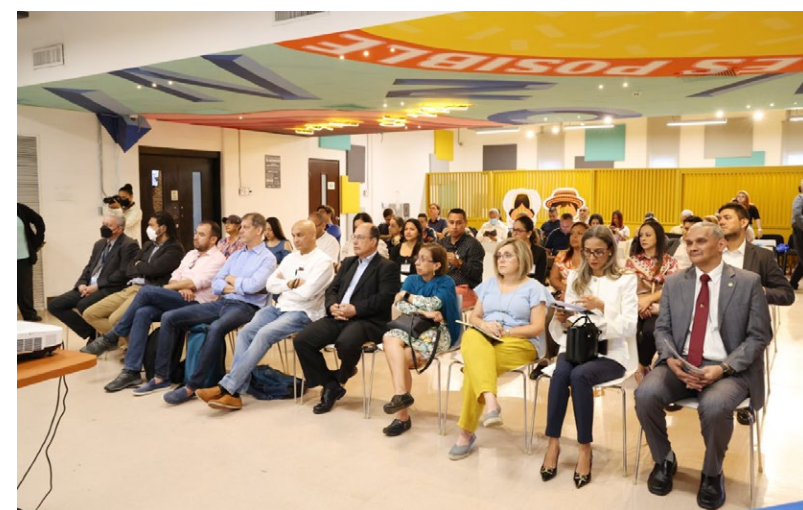
Representantes de las diferentes universidades quienes participaron de la sensibilización.

La inversión para profesores es de $90.00 dólares, estudiantes $80.00 dólares, investigadores agrícolas, técnicos de entidades públicas, privadas y público en general $140.00 dólares.