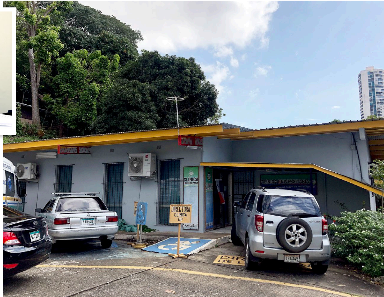
La Clínica Universitaria brinda los servicios de odontología, laboratorio, enfermería y medicina general.

Roner sostuvo que debido a la cantidad de pacientes que atienden los programas que se utilizan para capturar los datos están obsoletos.