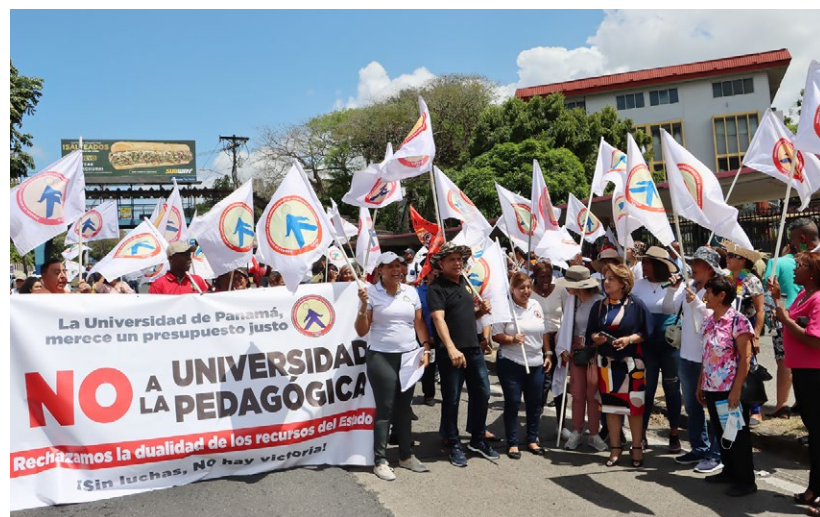
Manifestantes se mantienen alerta ante un posible madrugonazo carnavalero.

La decana argumentó que seguirán con las acciones de calle porque no solo afecta a los Campus Octavio Méndez Pereira y Harmodio Arias Madrid, también a la Facultad en sus 3 modalidades, sobre todo, el Centro Regional Universitario de Veraguas, la Extensión de Soná y más de 24 Programas Anexos . Recordó que en todas las provincias está representada la Facultad de Ciencias de la Educación.