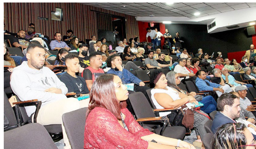
Público asistente a la sala de proyección cinematográfica.