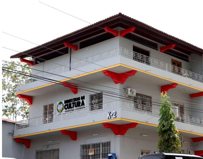
"El Rol de la Mujer en la gestión cultural universitaria: Aportes, Desafíos y Logros" es el tema a tratar en su programa Conexión Cultural.

También, señaló que es indispensable que el personal se mantenga en óptimas condiciones físicas, ejercitads y motivados a través del paquete de seminarios.