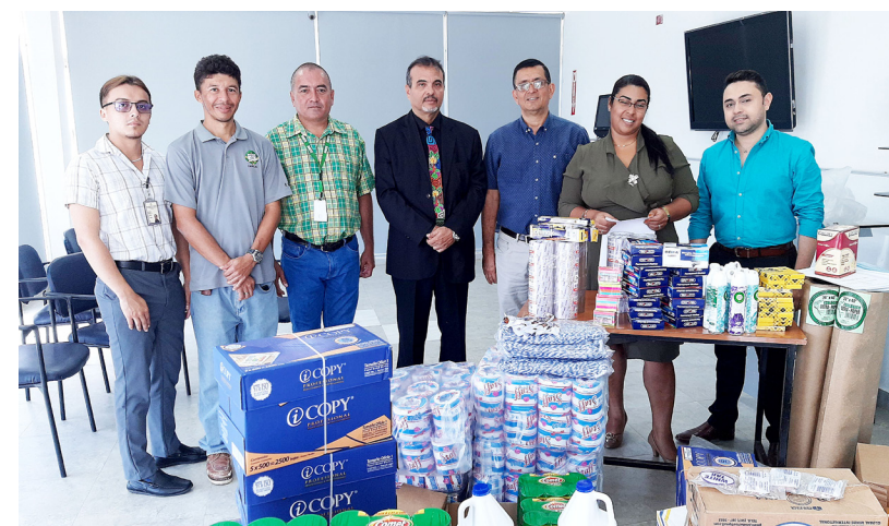
La Digite entregó insumos de oficina al Cidete de Los Santos.