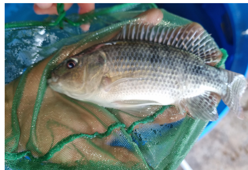
El proyecto que desarrolla la FCA es financiado por la Secretaría Nacional de Ciencia, Tecnología e Innovación (Senacyt).

El proyecto también es utilizado como una herramienta para la docencia, ya que los estudiantes podrán participar en algunas de las etapas o desarrollo del mismo, en trabajos de tesis o trabajos de grado.