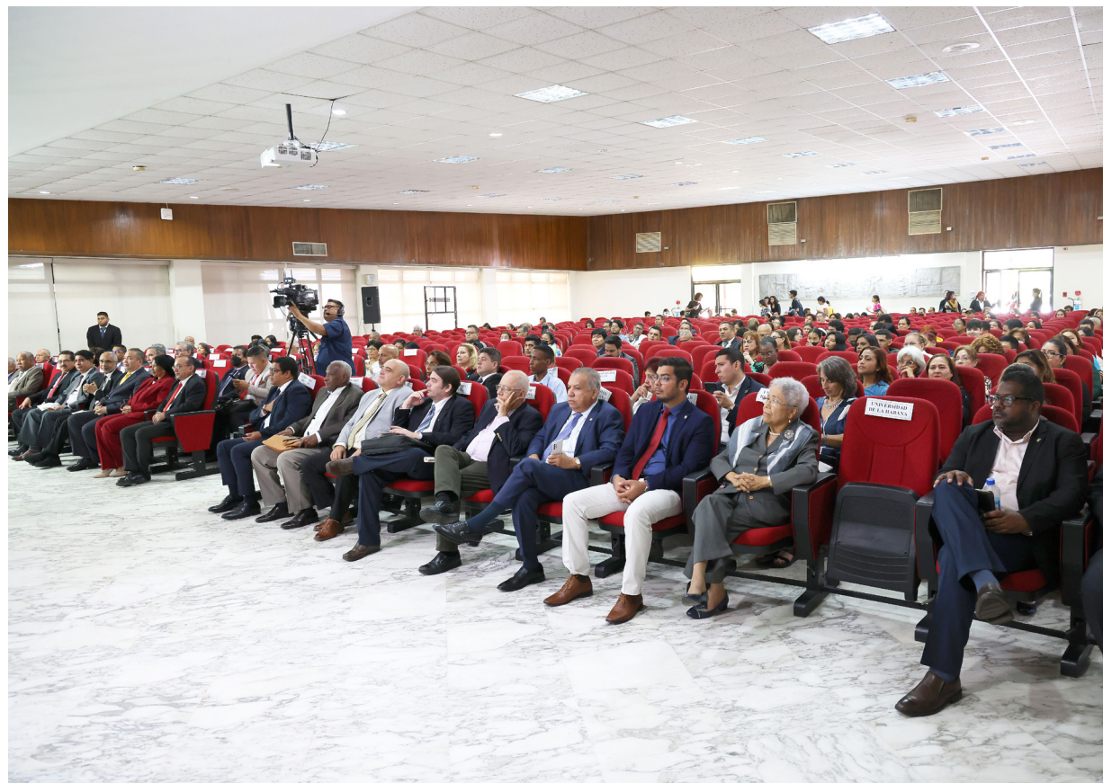
Nuestras universidades tienen la responsabilidad social de llegar a la población y a través de la EIV se está llegando a miles de personas.

El vicerrector de Extensión, magíster Ricardo Him, al momento de dar apertura al evento académico, recordó