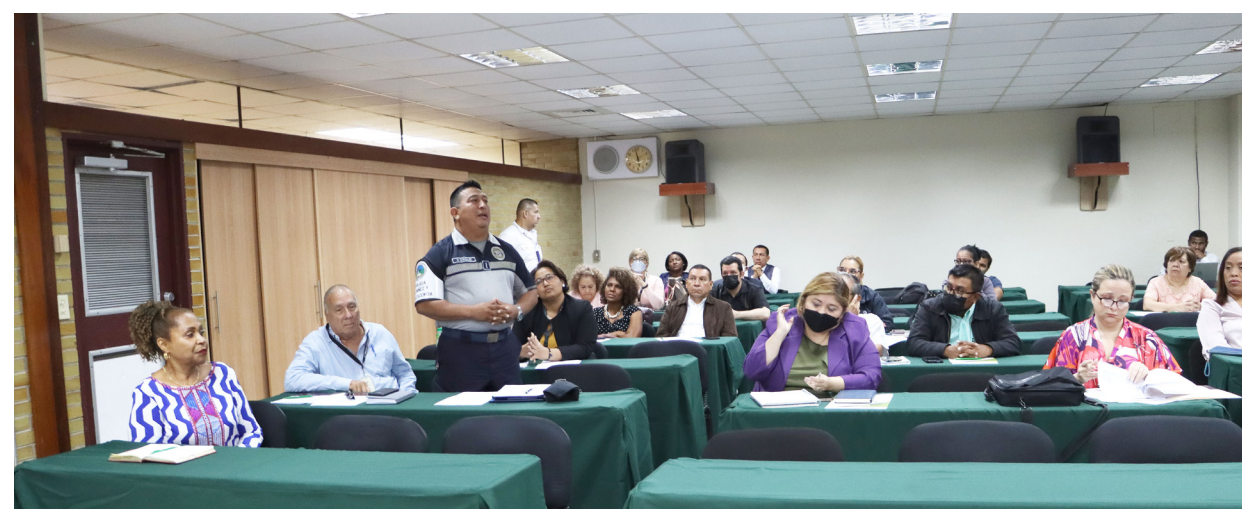
Miembros del comité interinstitucional que participan en la conformación de la mesa con miras a lo que será el III Congreso.

sexuales contra niños, niñas y adolescentes, forma parte de la instalación de la mesa de trabajo con miras al III Congreso para darle continuidad a una serie de trabajos que se han hecho previamente ya en mesas anteriores.