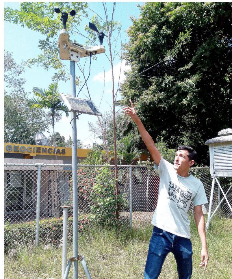
La estación meteorológica se abastece de energía solar.

Seguimos en pro de la investigación, aportando conocimiento científico.