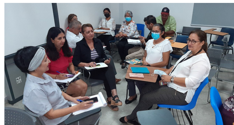
Docentes y administrativos se capacitaron en temas relacionados con planeación, organización, coordinación y control de actividades en las empresas.

Durante la capacitación se revisaron temas relacionados con: atención al público, ética administrativa, trabajo en equipo, espíritu colaborativo y capacitación permanente a docentes y administrativos del Centro Regional Universitario de Los Santos. Incluyó también a colaboradores de otras entidades, enfocadas en el alto grado de racionalidad en la planeación, la organización,