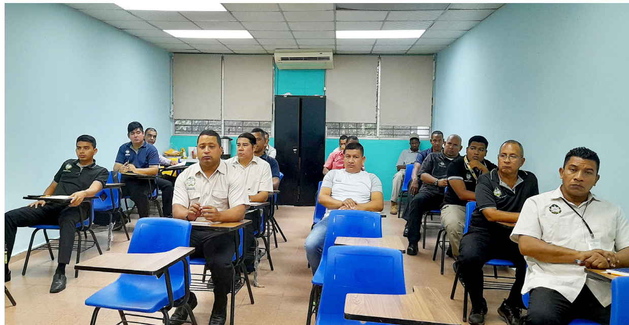
Miembros del Departamento de Protección Universitaria custodian las 24 horas del día las instalaciones de la Universidad de Panamá.

Entre los seminarios se destaca la redacción de informes