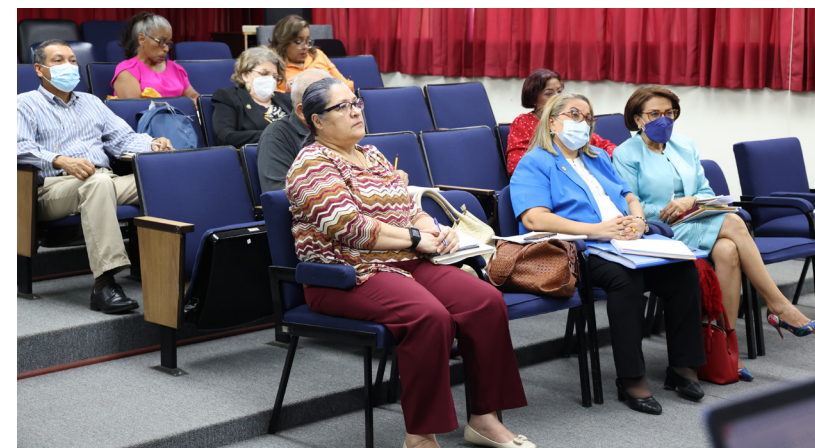
Apudep plantea el Foro Sobre Educación en conjunto con el Icase.

de trabajo que deben rendir informes para que una vez inicie el semestre desarrollar cada una de las actividades mencionadas.