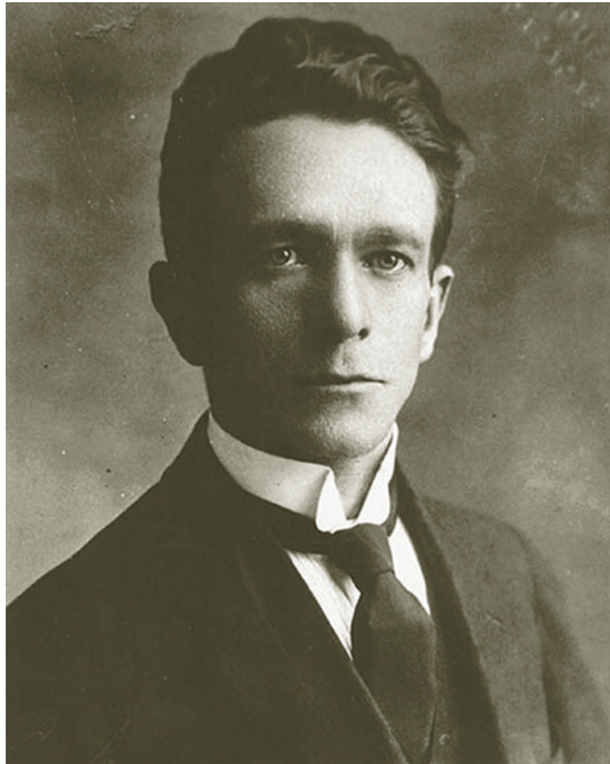
JOSÉ ANTONIO RAMOS SUCRE

"Este escepticismo es una nueva manera de apasionarse por el mundo, es un estilo deshacedor de normas y protocolos, todas las poéticas se disuelven, pero es también un juicio sobre el orden consagrado de la cultura y sus disciplinas, sobre las posibilidades del conocimiento, sobre la razón, en fin, todo cuanto sustente lo institucional"