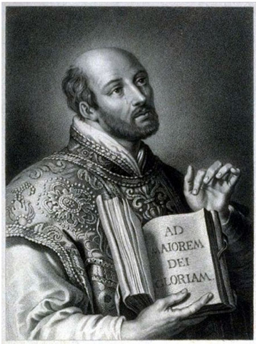
SAN IGNACIO DE LOYOLA

las universidades estatales ejercieron el dominio sobre las de la Iglesia y muchas facultades de teología fueron eliminadas en Francia e Italia, y las que sobrevivieron quedaron dominadas por el Estado. La libertad eclesial de enseñar quedó limitada y la influencia de las ciencias "profanas" o naturales se hizo más notoria y fuerte. Esto obligó a la Iglesia a fundar sus propios centros para el estudio de la filosofía y de la teología en los países latinos donde la enseñanza era claramente secularizada, o en los anglosajones, configurados por confesiones religiosas distintas del catolicismo. De modo que junto al sistema estatal o protestante se dio nueva vida a unas cuantas universidades "católicas" como la de Lovaina (1834-1835); el Instituto Católico de Francia (1875) y la de Friburgo en Suiza 4 . Incluso durante la Tercera República francesa se fundaron unas cuantas universidades católicas, pero a partir de 1876 se produjo una creciente polarización entre "liberalismo" y "clericalismo", que en 1905 desembocaría en la separación de la Iglesia y el Estado. Después de la Primera Guerra Mundial, nacieron otras universidades católicas en Dublín (1918), Milán (1920) y Nimega (1923). Se buscó estar a la altura de las nuevas exigencias de la modernidad y, a la vez, fortalecer la unidad de la fe y de la ciencia, por la inclusión de la teología como fundamento y corona de la misma institución educativa.