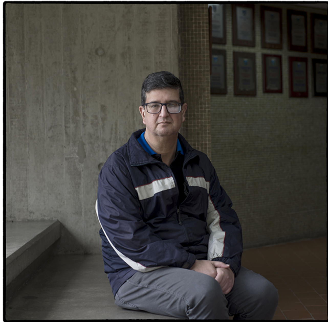
ARTURO PERAZA S. J.

Contexto y compromiso. son dos palabras que, en este sentido, repite una y otra vez el padre Arturo Peraza, S. J., rector de la universidad. "Poner a la universidad en el contexto del siglo 21", nos dice en su oficina, ordenada y a la vez llena de papeles y libros. Ese es el reto en el que está trabajando ahora. Porque lo logrado en el contexto venezolano no se refiere solo a sacar buenos puntajes en los ránquines o de ganar premios, sino de sobrevivir, en el sentido más pedestre del caso, y de ayudar a los otros a que lo hagan también. "De un universo de 16.000 estudiantes en el año 2015-2016 hemos pasado de un universo de aproximadamente un poco más de 7.000 estudiantes, eso es la mitad", y en la sede de Guayana, "donde había 3.300 estudiantes en algún momento, hoy en día estamos cerca de los 1000 estudiantes". Ante números como estos, había que hacer algo. Y algo urgente. "Desarrollar la capacidad de compromiso con el contexto social venezolano", señala, y, ante ello, "crear