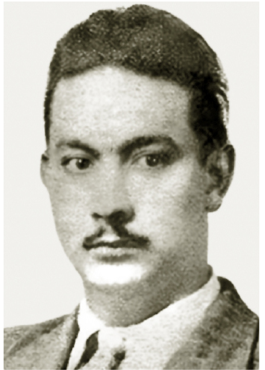
ANDRÉS MARIÑO PALACIO / ARCHIVO

Ideas y voluntad de marcar la realidad desde una personalidad donde se funden riesgo y vocación, admiro ese culto a la inconformidad de los discutidores, y esa cercanía inmediata a la encuentro en esos hombres austeros, nuestros tutores de espiritualidad. Sin ellos el perfil del futuro habría sido incierto y con seguridad expuesto a la frivolidad de la permanente fundación, la gratitud por ese camino allanado es en mi definitivo instrumento de escritura. Haberme encontrado con aquello que me esperaba ha sido recompensa y exigencia a la vez: núcleos de ideas y temas, títulos rotundos y énfasis estimulantes, problemas cuyo estatuto mismo