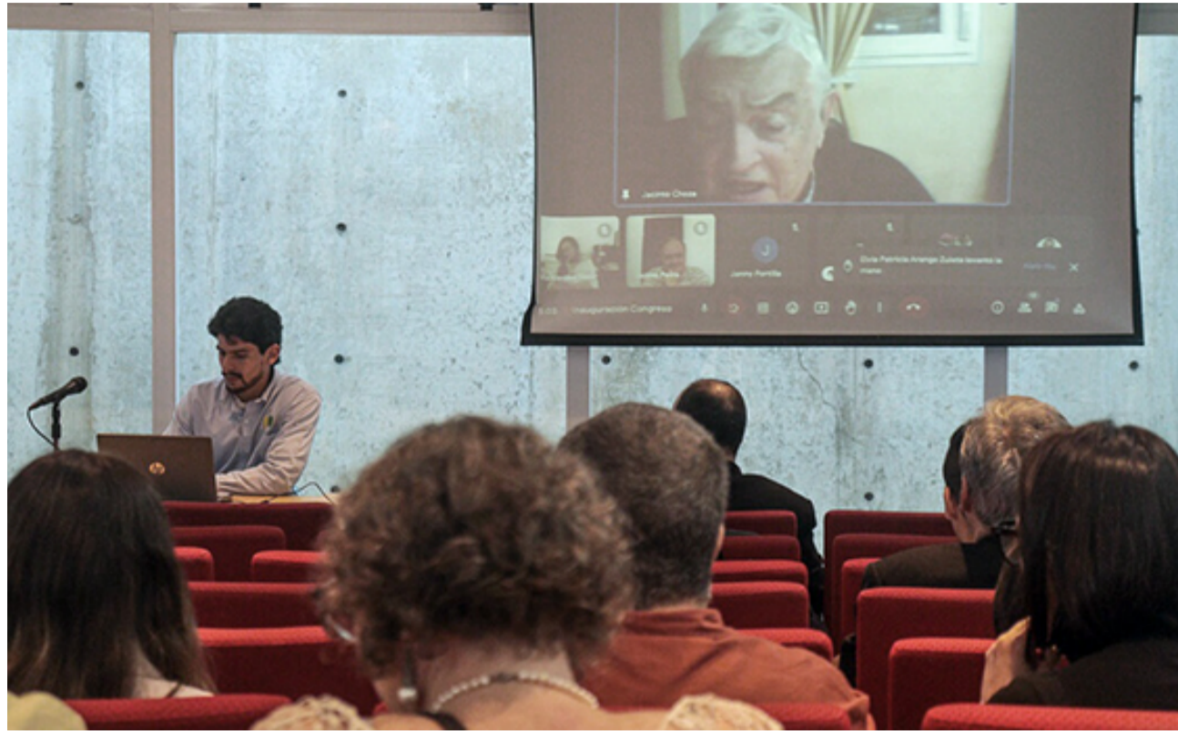
INAUGURACIÓN | CONGRESO INTERNACIONAL DE INVESTIGACIÓN DE LA UCAB

Con el paso del tiempo, se hizo evidente la necesidad de ampliar el ámbito de acción del CDCH. En consecuencia, el 21 de mayo de 2013, el Consejo Universitario de la UCAB aprobó el Reglamento del Secretariado de Investigación y del Consejo de Desarrollo Científico, Humanístico y Tecnológico. Mediante este decreto, se estableció que el Secretariado sería el órgano encargado de implementar la política de investigación de la universidad, así como de contribuir a la calidad docente a través de la generación de conocimiento, el perfeccionamiento y la especialización del profesorado mediante una