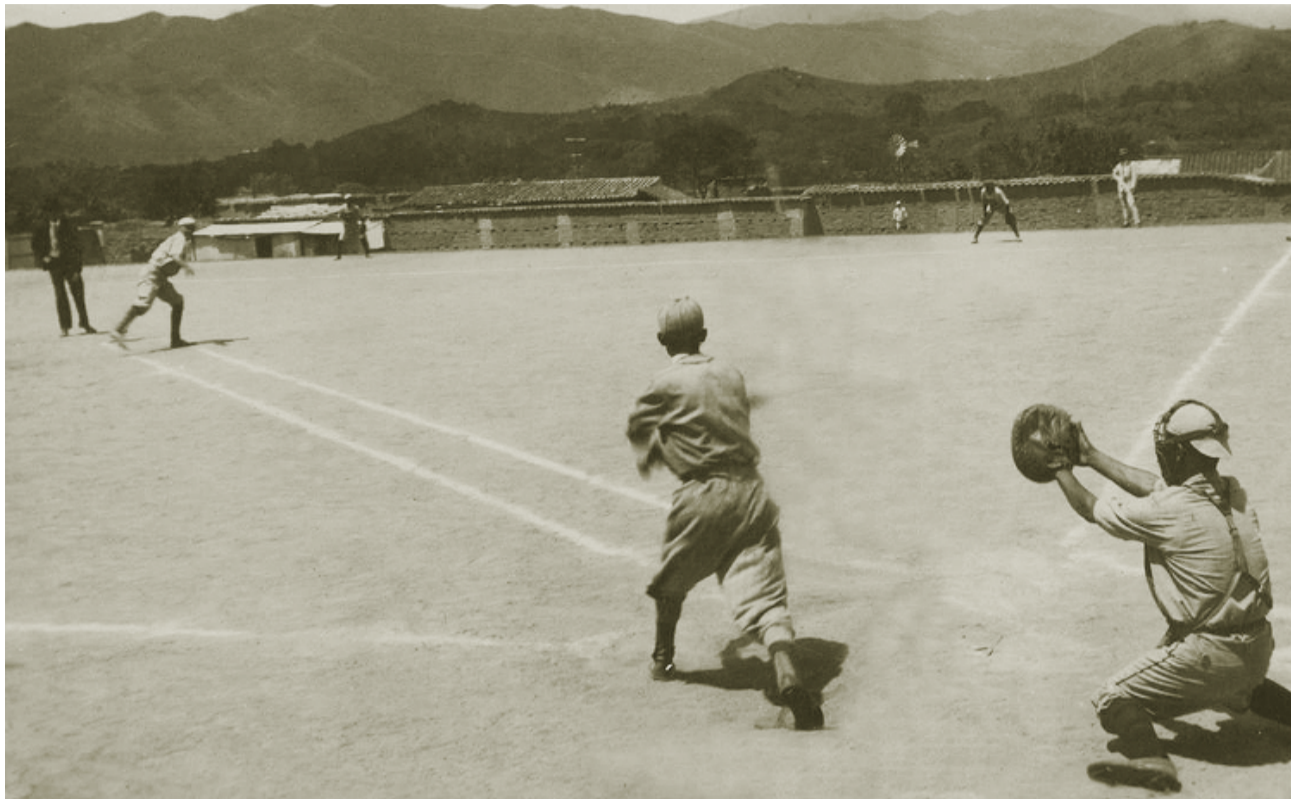
CAIMANERA / ARCHIVO

El término se ha extendido a todas las disciplinas deportivas e incluso a áreas