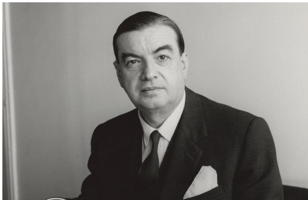
ROGER CAILLOIS