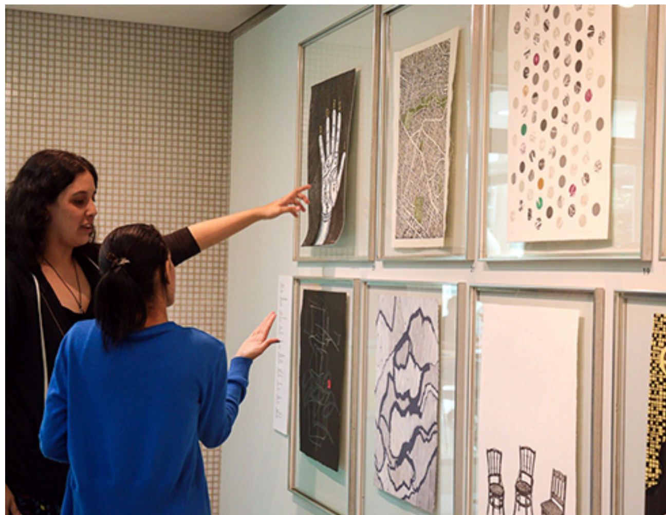
EXPOSICIÓN AMALGAMA GRÁFICA DEL TAGA EN LA UCAB

Entonces uno dice: se puede, si estamos insertos en el mercado internacional, también. La formación venezolana y la formación que recibieron en la UCAB los habilitó para un salto”