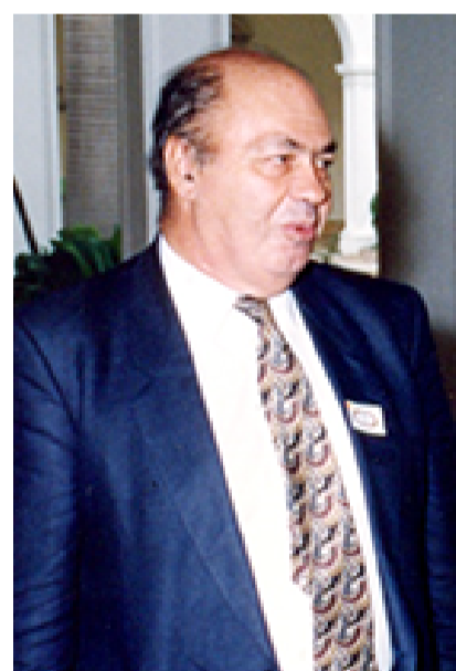
PEDRO CUNILL GRAU / ARCHIVO

Cunill hace uso del escáner histórico y espacial para confeccionar la crónica de la integración de los latinoamericanos con su ambiente, en el período temporal que corresponde a las transformaciones más radicales en cuanto a la intensidad de la acción humana sobre el continente. No se trata de una advertencia apocalíptica, al estilo de las previsiones del Club de Roma allá en los tecnológicamente lejanos años setenta. Pero sí es una cruda puesta en evidencia de los signos de los tiempos, de las heridas sobre la tierra y las consecuencias a futuro. No se trata tam-