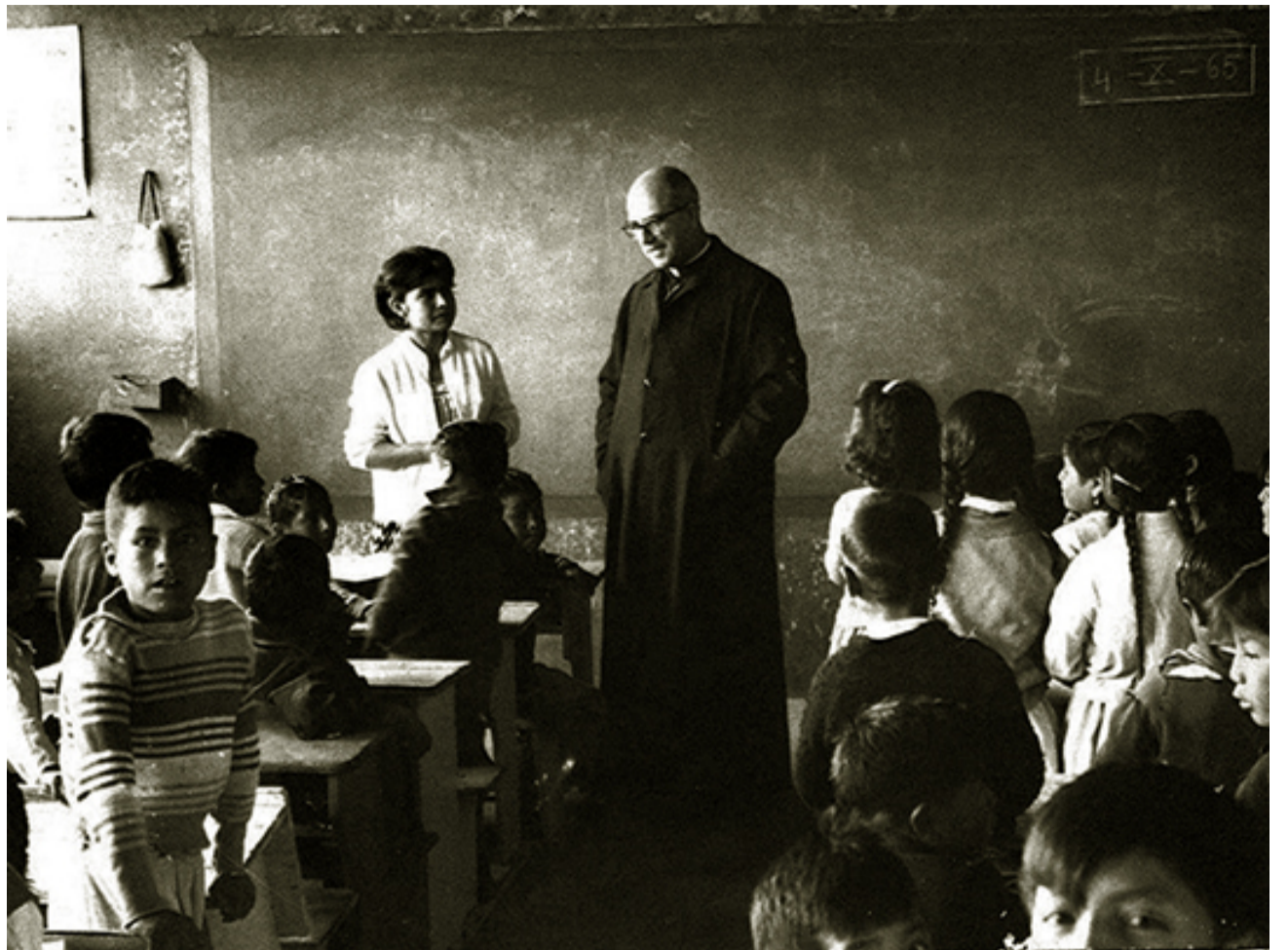
FE Y ALEGRÍA / EL UCABISTA

Otro principio de actualidad para la vida de las instituciones educativas de la Compañía de Jesús es el Magis 6 , que bien lo pudiéramos traducir en términos de la excelencia humana y académica de toda persona en buscar lo mejor para gloria de Dios y el servicio de los demás. El concepto no se resuelve en ser un extraordinario académico o profesional, sino que aquello que posee, lo disponga al servicio de los otros; a mejorar las condiciones de vida de los excluidos de la sociedad, con lo cual estará contribuyendo a construir el reino de Dios. Las estrategias básicas para el logro del aprendizaje según el Magis son la acción y la comunicación. No se concibe ni antes ni ahora una didáctica fundada en el receptor pasivo de las enseñanzas de su maestro. Es mediante la actividad mental y física como el estudiante puede llegar a apropiarse de los conceptos, las ideas y los principios útiles para la vida. Al mismo tiempo, la educación implica la comunicación de sentidos y significados entre el que aprende y el que enseña. De ahí la in-