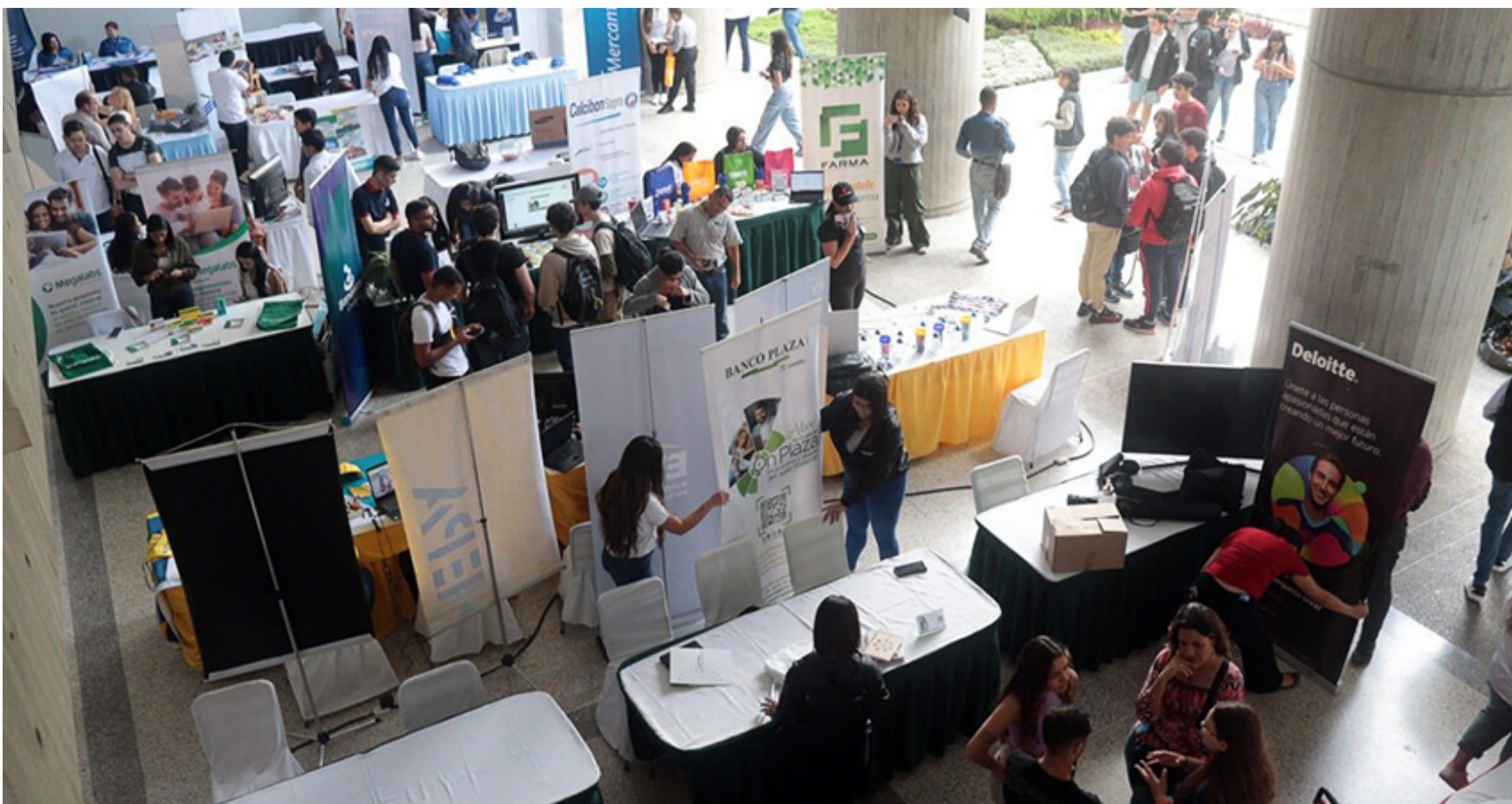
FERIA DE EMPLEO UCAB