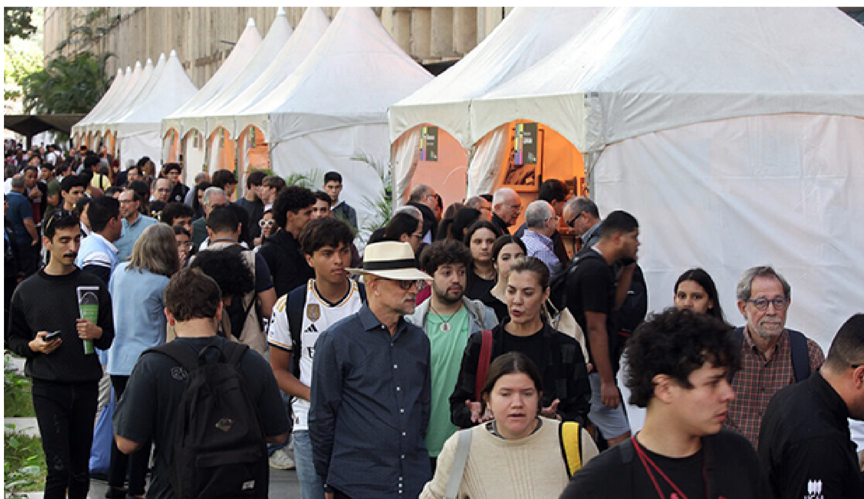
INAUGURACIÓN FLOC 2023