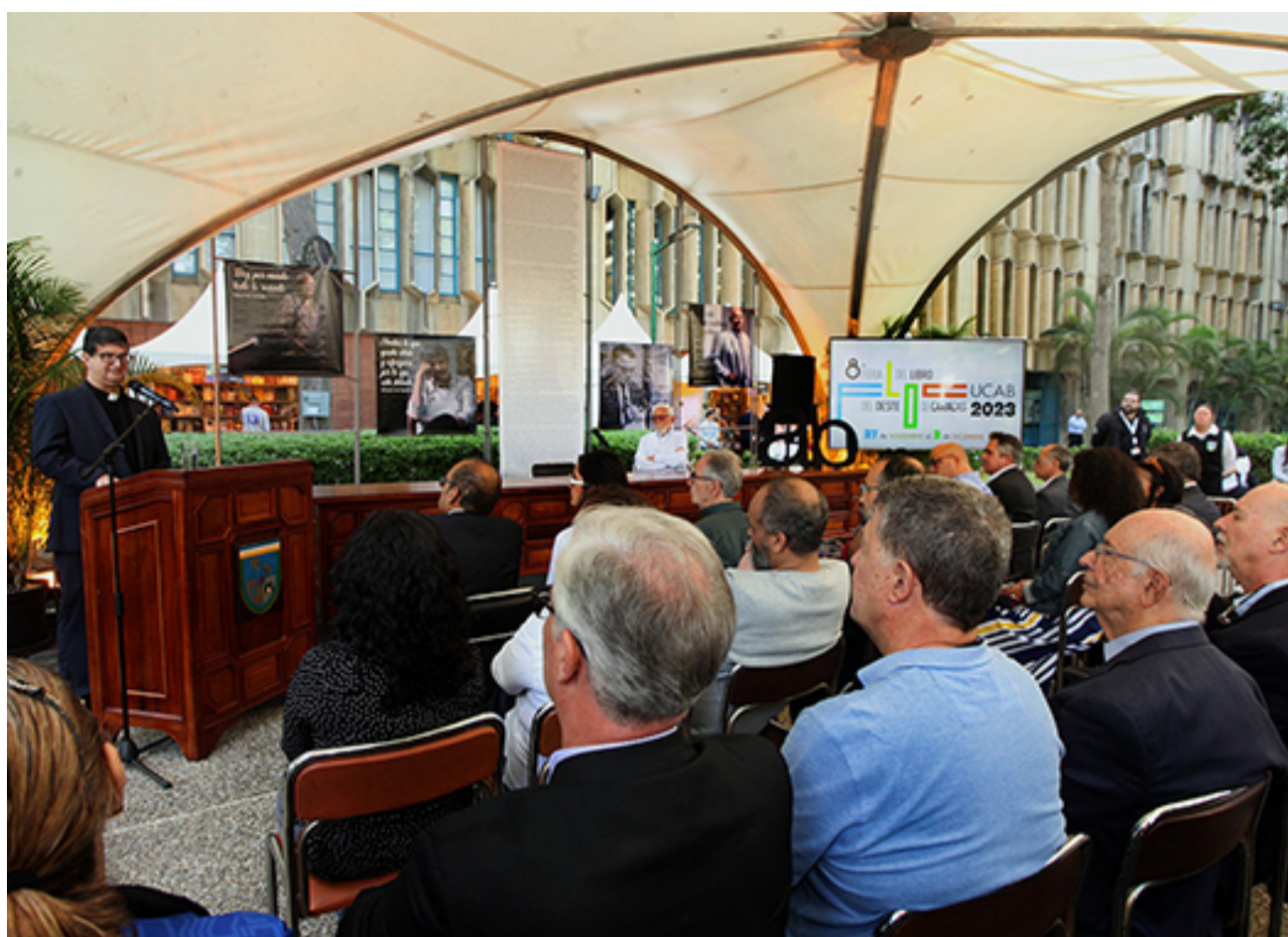
INAUGURACIÓN FLOC 2023

Esta línea de academias es una formación mucho más corta, mucho más ágil. Hecha fundamentalmente para brindar habilidades a los estudiantes pero que no se transforman solo en oficios. Aquí hay un intermedio muy interesante, porque claro que escuelas de oficios hay, en ellas vas a aprender a ser chef, a ser cocinero o algunos otros oficios que son importantes, son trascendentes en el país, pero que te convierten en el fondo en un asalariado. El problema justamente está en que la academia vincula elementos de la comprensión