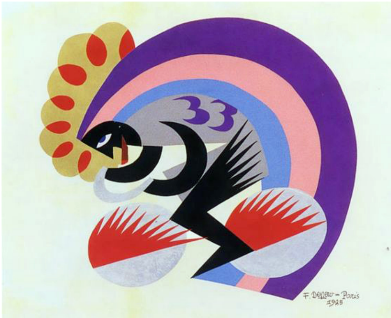
CICLISTA (1925) / FORTUNATO DEPERO