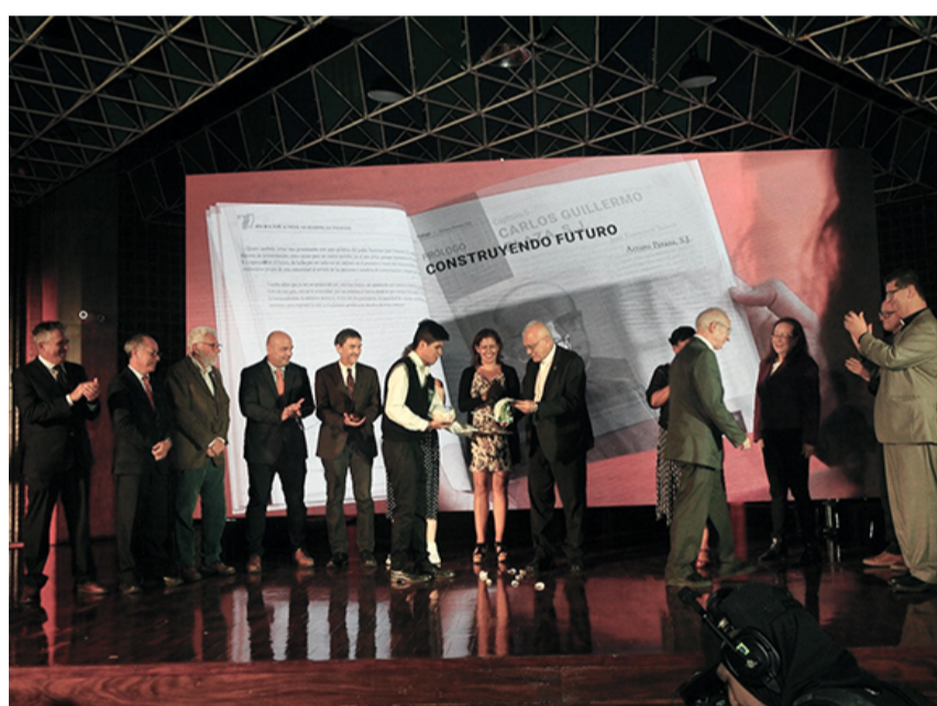
ACTO POR EL ANIVERSARIO 70

El Instituto de Investigaciones Históricas nace en 1957. Fue el primer Instituto de la universidad. El Centro de Investigaciones Económicas se creó en 1955 pasando en 1975 a ser el Instituto de Investigaciones Económicas y Sociales. En ese mismo año fue creado el Centro de Investigaciones Jurídicas, dando paso en 2007 al Instituto de Investigaciones Jurídicas. Respecto a la creación y fusión de centros de investigaciones tenemos que el Centro de Investigación de la Comunicación se creó en 1992. En el año 1997 aparecen dos centros: el Centro de Investigación y Desarrollo de Ingeniería con una unidad de consultoría y otra de emprendimiento tecnológico, y el Centro de Investigación y Evaluación Institucional. El Centro de Derechos Humanos nace en 1999, el mismo año de la Constitución. En el año 2000 se crea el Centro para la Educación, la Productividad y la Vida ubicado en la sede de UCAB Guayana bajo la modalidad interdisciplinar de investigación-acción. Veinte años después este centro da paso al actual Centro de Estudios Regionales. Todos los centros e institutos muestran en sus páginas sus proyectos, grandes logros, investigaciones emblemáticas las cuales se pueden consultar en el enlace de cen-