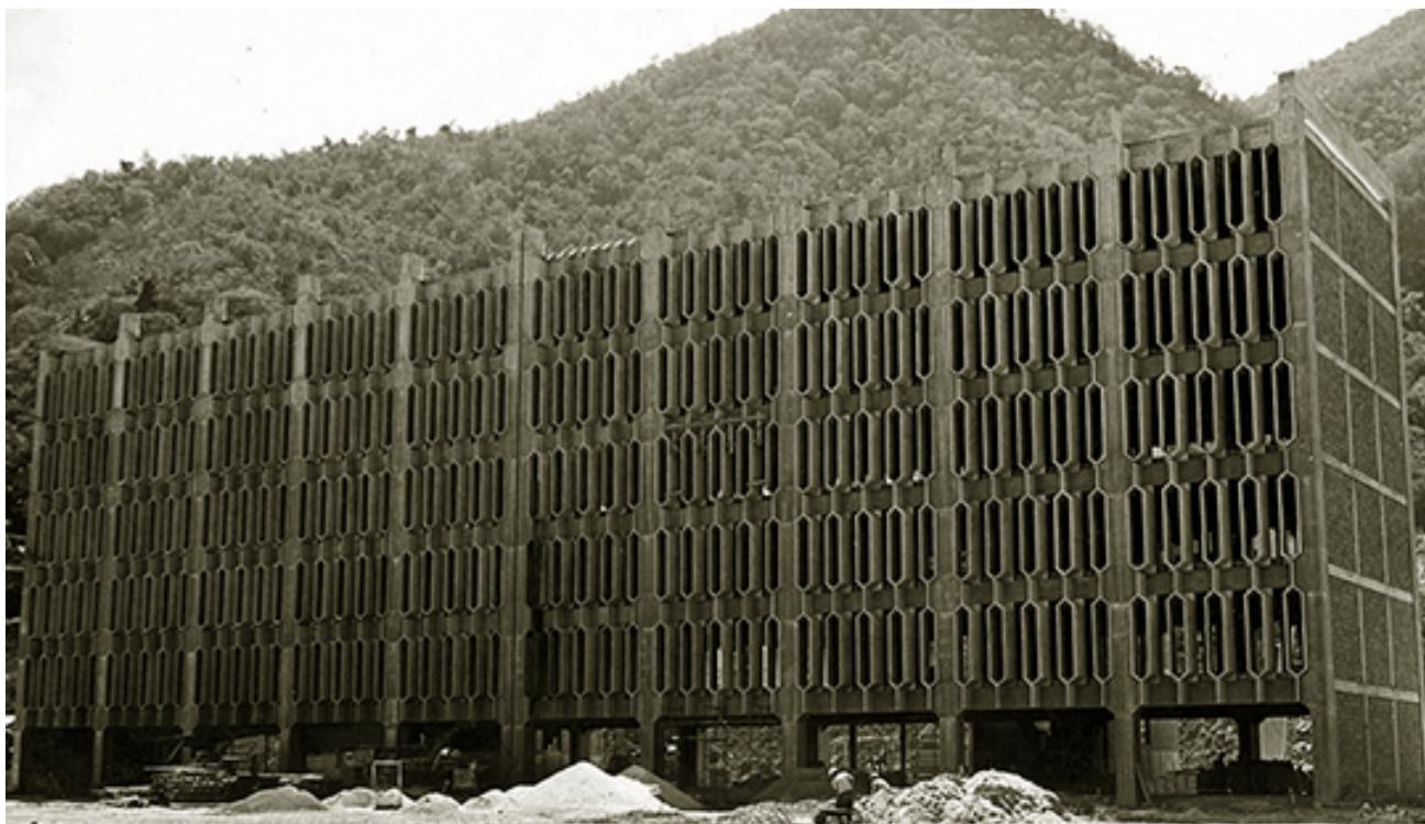
CONSTRUCCIÓN DE MÓDULOS DE LA SEDE EN MONTALBÁN (C. 1950)

Durante esos años, veía con tristeza y horror cómo en la vecina Escuela de Filosofía se iba cerrando el ingreso al primer año; en dos períodos más quedaría técnicamente cerrada. La lucha de los pocos estudiantes que tenía fue acogida por mí y varias de mis compañeras. Teníamos un “periódico” llamado Pandemonium , sacado con multígrafo, y en él yo tenía una columna que la llamaba “La puerta cerrada de la Escuela de Filosofía”. Con ello, tratábamos de sensibilizar a los lectores para que se unieran a la lucha por impedir su cierre.